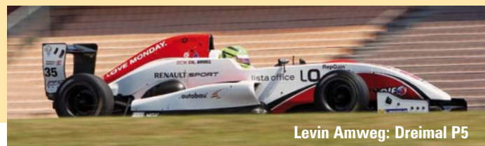
Levin Amweg: Dreimal P5