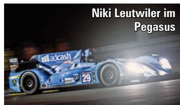
Niki Leutwiler im Pegasus