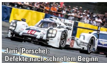
Jani (Porsche): Defekte nach schnellem Beginn