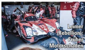
Leimer (Rebellion): Früher Motorschaden