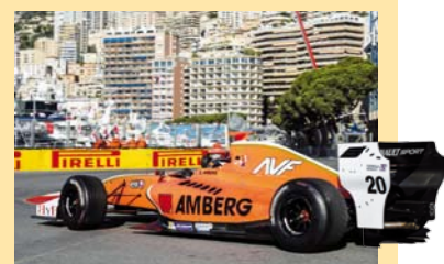
Zoel Amberg: P6 in Monaco