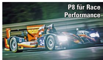
P8 für Race Performance