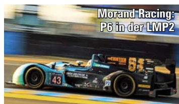
Morand Racing: P6 in der LMP2